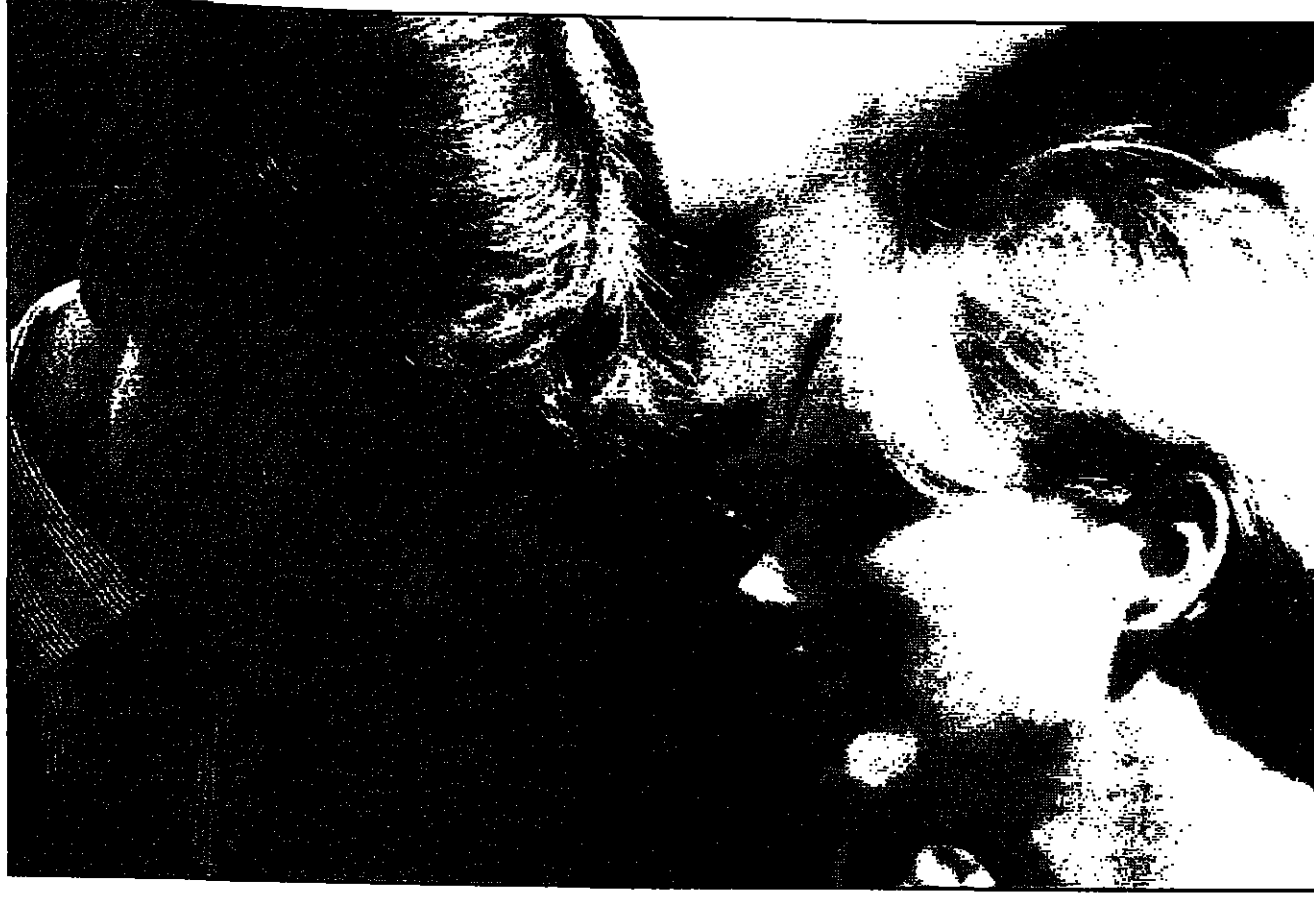
زوا ابنة الاميرة أن بصحة الامير ولديم ابن خالها الامير شارلوز شهدا الاحتفال بعيد ميلاد الملكة الام

تقبل المراهقات على التدخين كوسيلة لتفادي أوزانهم. ويقول باحثون أجروا دراسة على 3000 مراهقة في لندن وإيطاليا يقبلن أن 20 في المئة ممن مدخنات. وتكون تلك المدخنات كن من المراهقات في العاشرة. قال البروفيسور آرثر كريس من مستشفى سانت جورج في لندن بالتحقق صلة مهمة بين التدخين والخوف من البدانة بين المدخنات لتتراوح أعمارهن بين 11 و18 سنة. وأغلبية البنات المدخنات هن اللواتي يبدن ويتدخنن للتدخين للحد من الشهية والبيضاء لجأ إلى التدخين عوضاً عن تناول الطعام. وتزعم أغلبية البنات البريطانيات أن وزنهن نقص ثمانية كيلوغرامات منذ سن البلوغ. وقال كريس الذي قام بأبحاث مستفيضة عن عيوب عادات الأكل في الدراسة لصحيفة مؤشراً إلى صعوبات تواجهها مراهقات في التعامل مع سن البلوغ وبدن الجسم بغيره. ويشير إلى أنها ظاهرة أوروبية لا تؤثر في المراهقات في بريطانيا. وكريس من مستشفى سانت جورج في لندن يدرس أيضاً بين أناس مصابين بالخلل في عادات الأكل وأن مراهقات يعتقدن أن التدخين الأيسر سناً وشيقات. وتكشفت الدراسة التي مولتها مؤسسة الحملة ضد السرطان أن المراهقات اللاتي يشربن الخمر أكثر تعرضاً للجوع إلى التدخين بمقدار سبعة أمثال من قرباتهن اللاتي لا يتناولن الخمر. كما أن المقارنة مع زميلات أول وزنا والحماية مع والدين مدخنين تشكلن ضغوطاً على المراهقات قد تدفعهن إلى اللجوء للسجائر.